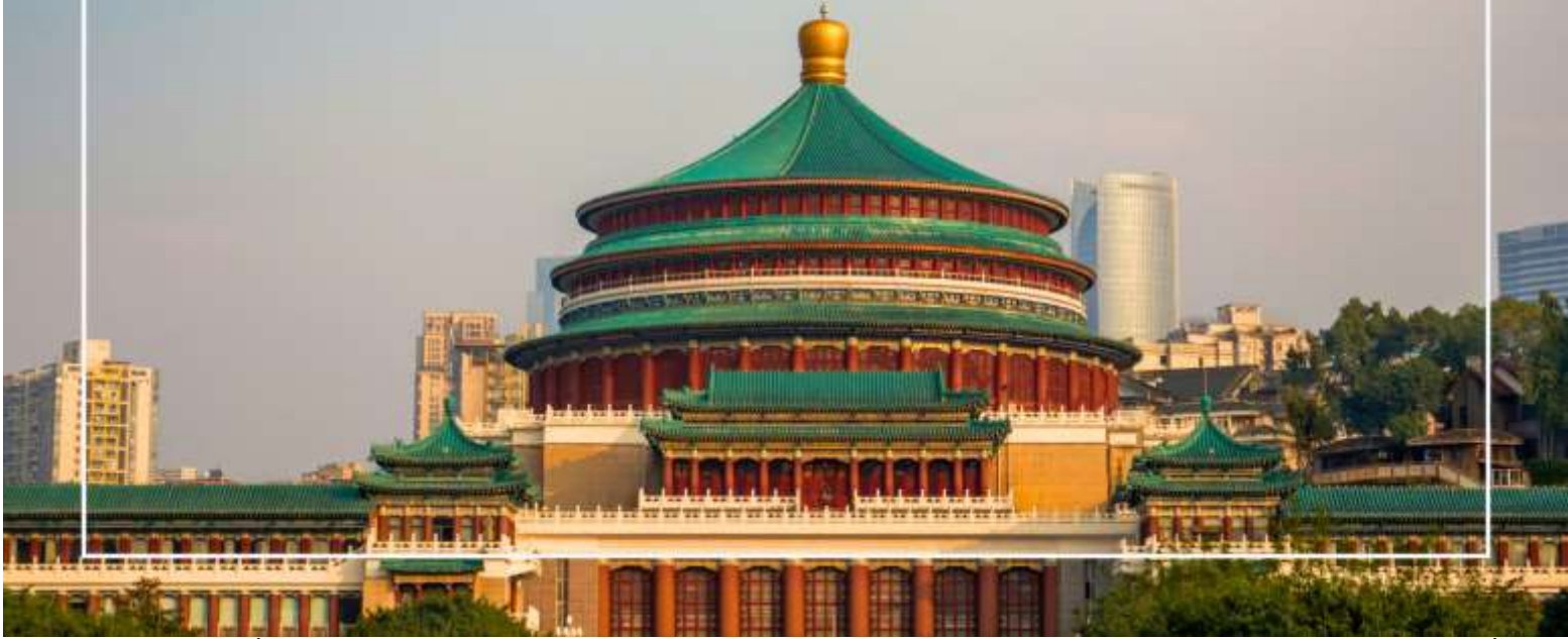
มหาศาลาประชาชนแห่งเมืองฉงชิ่ง (Chongqing People's Grand Hall)

จากนั้นนำท่าน นั่งรถไฟทะเลลู่ตีก เป็นหนึ่งในประสบการณ์ที่น่าสนใจและเป็นเอกลักษณ์ในเมืองฉงชิ่ง รถไฟเส้นนี้มีเส้นทางที่ผ่านอาคารและที่อยู่อาศัย ทำให้ผู้โดยสารรู้สึกเหมือนกำลังนั่งรถไฟที่ทะลุผ่านตึกสูง เส้นทางที่น่าสนใจในรถไฟนี้รวมถึงสถานีที่มีชื่อเสียง เช่น สถานีหลี่จื่อป่า (Liziba Station) ซึ่งตั้งอยู่ในพื้นที่ที่มีความหนาแน่นของประชากร การนั่งรถไฟทะเลลู่ตีกนี้เป็นวิธีที่ยอดเยี่ยมในการสัมผัสกับวัฒนธรรมเมืองฉงชิ่งและชื่นชมกับการพัฒนาเมืองที่น่าทึ่ง