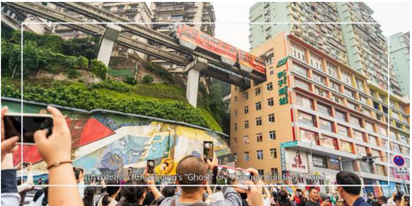
รถไฟทะเลลู่ตีก (Chongqing's "Ghost" or "Through" Building)

จากนั้นนำท่าน นั่งรถไฟทะเลลู่ตีก เป็นหนึ่งในประสบการณ์ที่น่าสนใจและเป็นเอกลักษณ์ในเมืองฉงชิ่ง รถไฟเส้นนี้มีเส้นทางที่ผ่านอาคารและที่อยู่อาศัย ทำให้ผู้โดยสารรู้สึกเหมือนกำลังนั่งรถไฟที่ทะลุผ่านตึกสูง เส้นทางที่น่าสนใจในรถไฟนี้รวมถึงสถานีที่มีชื่อเสียง เช่น สถานีหลี่จื่อป่า (Liziba Station) ซึ่งตั้งอยู่ในพื้นที่ที่มีความหนาแน่นของประชากร การนั่งรถไฟทะเลลู่ตีกนี้เป็นวิธีที่ยอดเยี่ยมในการสัมผัสกับวัฒนธรรมเมืองฉงชิ่งและชื่นชมกับการพัฒนาเมืองที่น่าทึ่ง