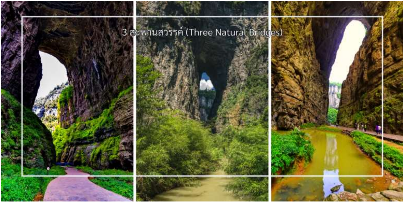
3 สะพานสวรรค์ (Three Natural Bridges)

เย็น บริการอาหารเย็น ณ ภัตตาคาร (มื้อที่3) เมนูพิเศษ : อาหารเสฉวน จากนั้นเดินทางเข้าสู่โรงแรมที่พัก Wulong yiyun Hotel ระดับ 4 ดาว หรือเทียบเท่า