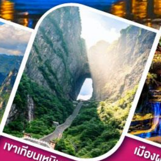
เวาเทียนเหมินชาน