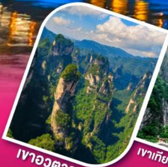
เวาอวตาร