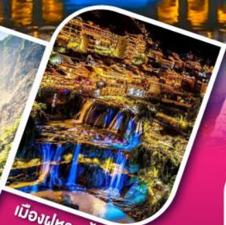
เมืองผู่หลงเจิ้น